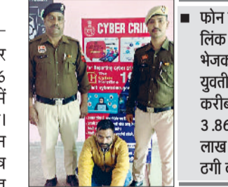
मैं कार्यरत है। उसके मोबाइल फोन पर गत 2 जनवरी को एक लिंक आया था। उसने लिंक पर क्लिक किया तो उसके बैंक खाते से 3 लाख 86 हजार 78 रुपये कट गए। यह राशि 2 से 3 जनवरी के