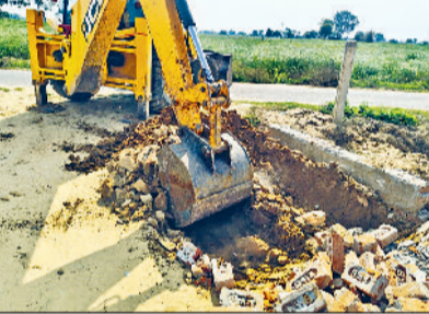
रेवाड़ी। अवैध कॉलोनी का निर्माण तोड़ती जेसीबी।

डीटीपी विभाग की टीम ने मंगलवार को रेवाड़ी-शाहजहांपुर रोड की राजस्व सीमा में अवैध रूप से विकसित की जा रही दो कॉलोनियों व अवैध निर्माणों पर तोड़फोड़ की कार्रवाई की। पुलिसबल की मौजूदगी में डीटीपी की कार्रवाई का कहीं विरोध नहीं हुआ। डीटीपी की लगातार कार्रवाई के बाद भी कॉलोनाइजर व डीलर नई