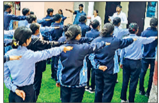
आयोजन किया गया। कार्यक्रम में विद्यार्थियों को एंटीबायोटिक दवाओं के

अहीर कॉलेज तथा अहीर नर्सिंग महाविद्यालय के संयुक्त तत्वाधान में एंटीबायोटिक दवाओं के सही उपयोग को लेकर जागरूकता कार्यक्रम का