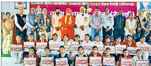
रेवाड़ी। कार्यक्रम में मौजूद शिक्षक व विद्यार्थी।

निकाय चुनावों को लेकर भाजपा और कांग्रेस दोनों में कुछ हलचल जरूर है, परंतु दूसरे दल अभी सामने नहीं आ रहे हैं। इन्तेली, जेजेपी और आम आदमी पार्टी की ओर इन चुनावों को लेकर कोई चर्चा तक नहीं की जा रही है। पिछले चुनावों में जेजेपी ने धारुहेड़ा में चेयरमैन हासिल करने के पूरा जोर लगाया था। एक बार चुनाव कैसिल होने के बाद दूसरी बार जेजेपी का जोश भी ठंडा पड़ गया था। इस बार इन दलों ने चुनावों को लेकर कोई खास तैयारी तक शुरू नहीं की है।