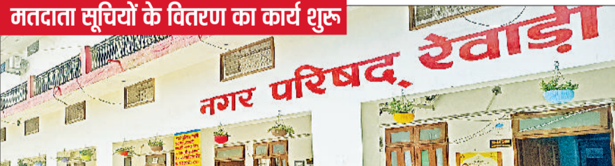
रेवाड़ी। नगर परिषद कार्यालय।

नगर परिषद और धारुहेड़ा नगर पालिका का कार्यकाल जनवरी माह में पूरा हो गया था। इसके बाद इनकी शक्तियां प्रशासनिक के हाथों में आ गई थीं। पहले चुनाव फरवरी या मार्च में ही कराए जाने के कयास लगाए जा रहे थे, परंतु मतदाता सूचियों के अंतिम प्रकाशन में देरी के चलते चुनाव कुछ माह बाद कराए