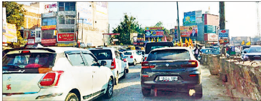
रेवाड़ी। मंगलवार सुबेी वन-वे करने पर नाइवाली चौक पर लगा जाम।

सरकुलर रोड पर बस स्टैंड और बीएमजी मॉल के पास सड़क निर्माण का कार्य चल रहा है। इस कारण रोड का एक हिस्सा बंद किया हुआ है