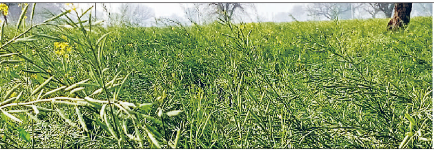
रेवाड़ी। एक खेत में पकाव की ओर सरसों की फसल।

फरवरी का दूसरा पखवाड़ा शुरू होते ही मौसम का गर्म मिजाज ठंडा पड़ना शुरू हो गया है। दिन के तापमान में 3.0 डिग्री तक की गिरावट दर्ज की गई, जिससे मौसम में गर्मी का असर कम हो गया। 18 फरवरी को कमजोर विक्षोभ की सक्रियता के चलते आसमान में बादल छाने और बूदाबांदी की संभावना जताई जा रही है। मंगलवार को सुबह से ही आसमान साफ रहा। सूरज की तेज चमक बरकरार रही। 12 किलोमीटर प्रति घंटा की रफ्तार से ठंडी हवाएं चलने