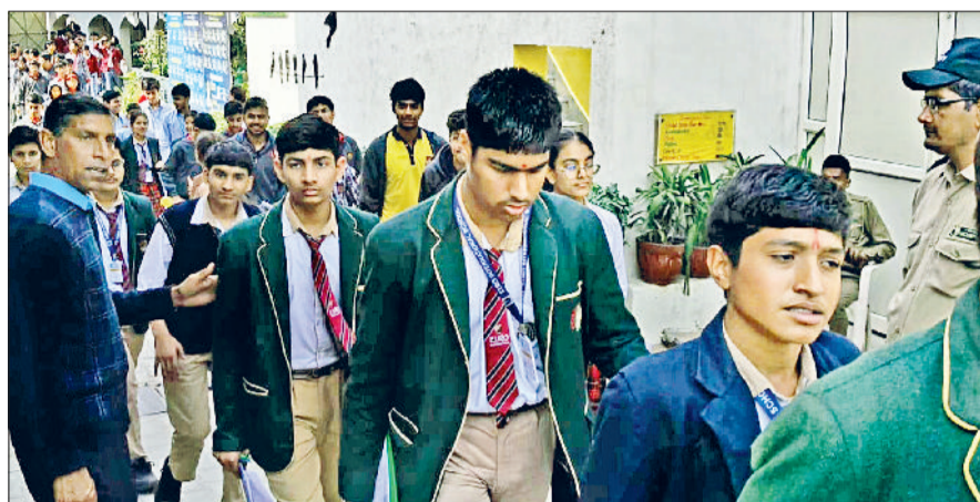
रेवाड़ी। होली चाइल्ड स्कूल से दसवीं का पेपर देकर निकलते परीक्षार्थी।